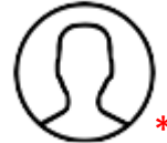
DSB extern *